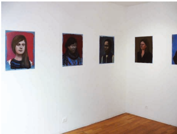
Ausstellungsansicht in der/ exhibition view in the/ vue de l'exposition à la Galerie du Tableau, Marseille 2/2009